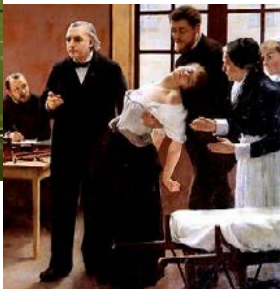
« Leçon particulière à la Salpêtrière » Charcot